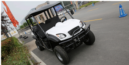
Una unidad TT.402 pintada en color Pure White dando servicio en un campus empresarial.