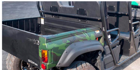
Un amplio espacio de carga junto a sus 4 plazas convierte al TT.402 en un todoterreno muy práctico