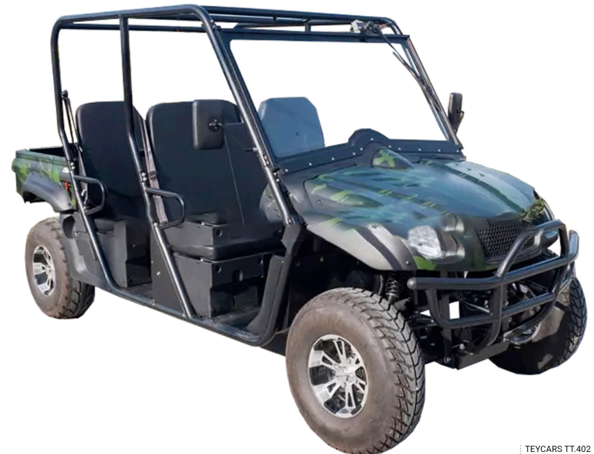
TEYCARS TT.402 Pintura 'Green Camouflage'

La manera como te mueves dice mucho de ti